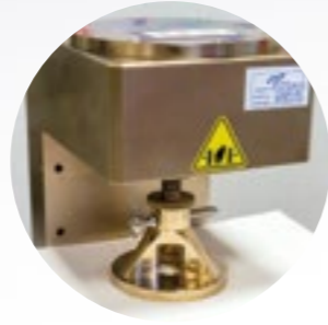
Berstfestigkeit (BST) ISO 2759