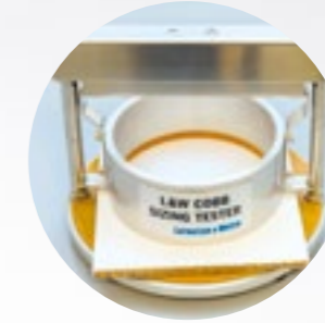
Wasserabsorptionsvermögen (Cobb 1800) ISO 635